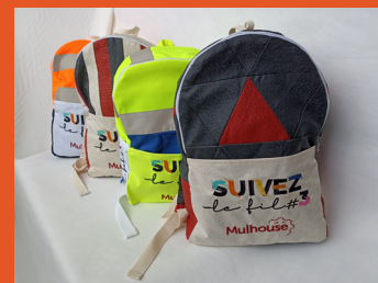
Sac Totem fabriqué par La Petite Manchester

Les entreprises sont engagées dans des labels et certifications d'excellence :