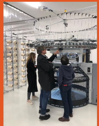
Bonneterie Au fil d'Altair