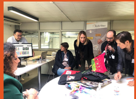
Brunch chez Trium Technology

Dans le cadre de la Feuille de route Textile Grand Est 2021-2023, le Pôle Textile Alsace a bénéficié d'un soutien financier de la Région Grand Est à hauteur de 360 270,00€ sur 3 ans, soit 37% des recettes de l'association.